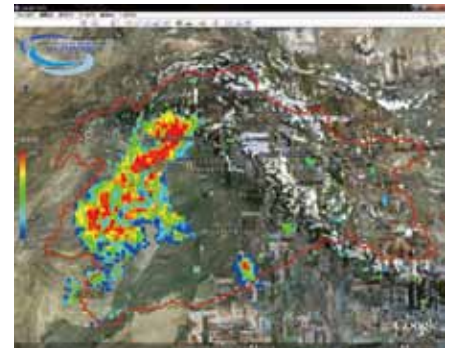
Precipitation distribution over the Indus river basin in Pakistan on July 2010. (created based on JAXA's GSMaP NRT, a satellite observation rainfall data, and corrected by ICHARM)

ICHARM and JAXA are participating in this project to further promote capacity development in flood forecasting and early warning and flood management over the Indus river basin jointly with Pakistan's government agencies such as the Pakistan Metrological Department, the Pakistan Space and Upper Atmosphere Research Commission and the Federal Flood Commission.