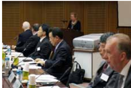
HLEP/UNSGAB urgent meeting on the Great EQ and Tsunami of East Japan in session.

The High-Level Expert Panel on Water and Disaster (HLEP) of the United Nation Secretary General's Advisory Board on Water and Sanitation (UNSGAB) met at the JICA Research Institute in Tokyo on 28 April to discuss "How should the world improve the preparedness for mega-disasters?" at a special meeting organized by the Ministry of Land, Infrastructure, Transport and Tourism (MLIT) and the Japan International Cooperation Agency (JICA) and supported by ICHARM.