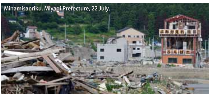
Minamisanriku, Miyagi Prefecture, 22 July.

At the World Cup final, Nadeshiko displayed a banner with a message to the world: "To Our Friends Around the World — Thank You for Your Support". All of us at ICHARM share exactly the same feeling with them. We are anxiously waiting to see people from around the world at ICFM5.