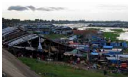
People living on the water in Kampong Thom lead a hard life.

同じ2011年6月、経済社会世帯調査が Kampong Thom, Kandal, PreyVeng 州で実施されました。480世帯と48村における調査は、無事に終了しました。今後、PhC と SoC を考慮し、FVI を策定する予定です。